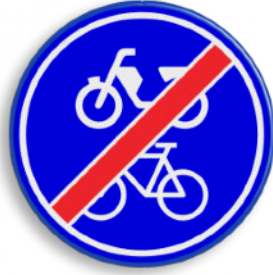
Einde verplicht fietspad / bromfietspad