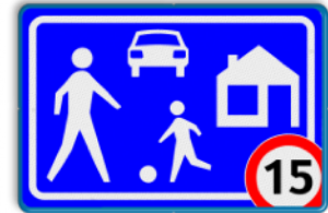
Woonerf met snelheidsbeperking