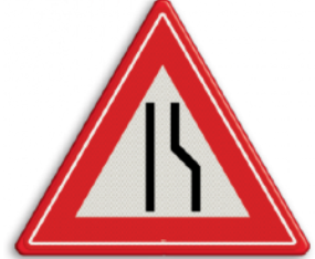
Rijbaan versmalling rechts