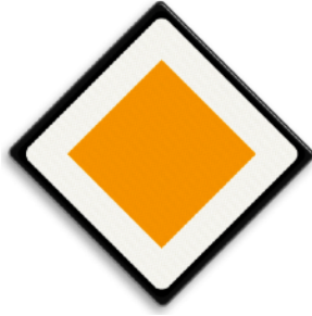
Vorrangsweg Zolang je rechtdoor rijdt