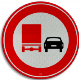
Verbod voor vrachtauto's om motorvoertuigen in te halen