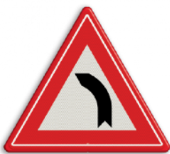
Bocht naar links Let extra goed op voor tegenliggers