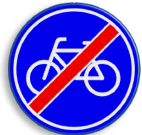
Einde verplicht fietspad