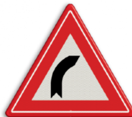
Bocht naar rechts