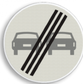
Einde inhaalverbod voertuigen