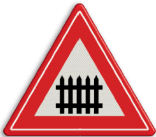
Overweg met slagbomen