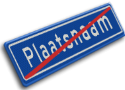
Einde bebouwde kom max. 80 km/u