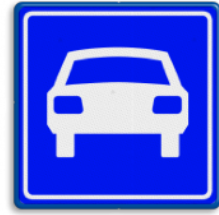
Autoweg min. 50 - max 100 km/u