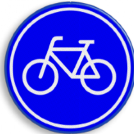
Fietspad voor fietser en snorfietzers