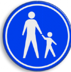
Voetpad Stoep - trottoir