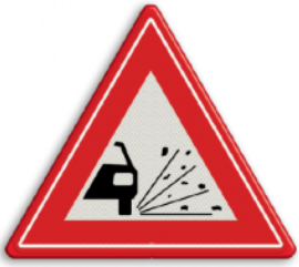
Losliggende stenen Opspattend grind