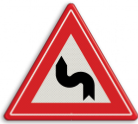
S-bocht(en) eerst naar links Geen slipgevaar, tenzij dit wordt aangegeven