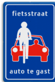
Fietsstraat - auto te gast