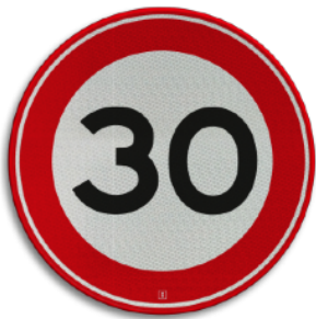
Maximum snelheid 30 km/h. Hier heb je uiteeraard meerdere borden van met andere snelheden