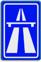
Autosnelweg min. 60 - max. 100 km/u tussen 06:00 en 19:00 uur min. 60 - max. 130 km/u tussen 19:00 en 06:00 uur