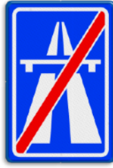
Einde Autosnelweg max. 80 km/u