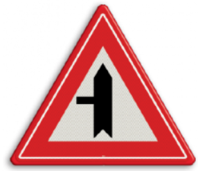
U nadert een voorrangskruispunt met een weg van links, u heeft voorrang