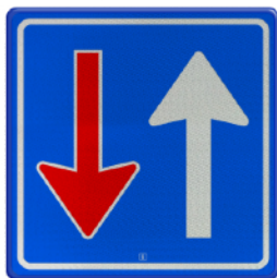
Tegenligger moet wachten Jij hebt voorrang!