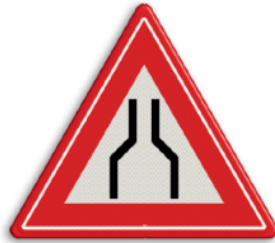
Rijbaan versmalling aan 2 zijden