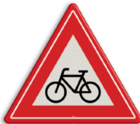
Oversteekplaats (brom-) fietsers