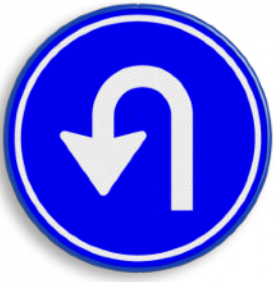
Verplicht te keren