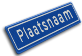
Start bebouwde kom max. 50 km/u