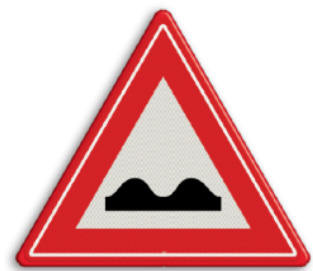
Slecht wegdek Zowel autoweg als snelweg