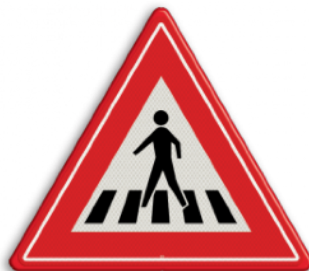
Voetganger oversteekplaats met zebra pad Voetganger en gehandicapten gaan altijd voor (fietsers niet!)