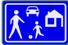
Woonerf max.15 km/u - stapvoets