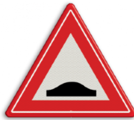
Verkeersdrempel Nooit op snelweg