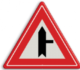
U nadert een voorrangskruispunt met een weg van rechts, u heeft voorrang