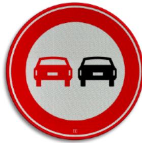
Verboden in te halen