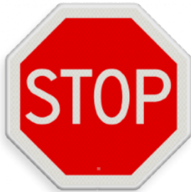
STOP: verleen voorrang aan de bestuurders op de kruisende weg. Minimaal 2 sec wachten