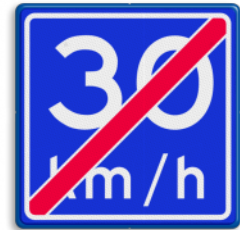
Einde adviessnelheid 30 km/h