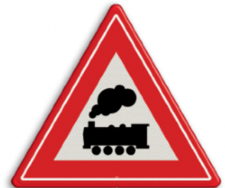
Overweg zonder slagbomen