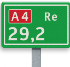
Hectometerbord Elke 100 meter kom je dit bord tegen op de Autosnelweg