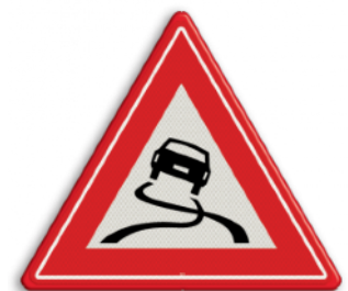
Slipgevaar (glad wegdek)