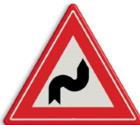
S-bocht(en) eerst naar rechts