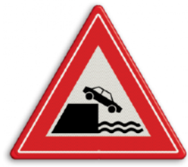
Kade of rivieroever