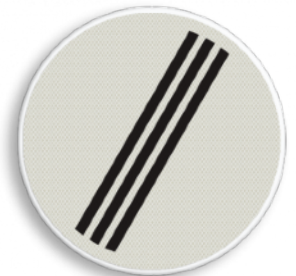
Einde van alle door verkeersborden aangegeven verboden