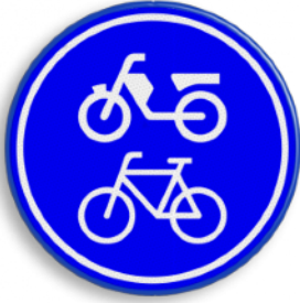
Verplicht fietspad / bromfietspad