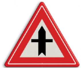
Vorrangskruispunt - U heeft voorrang Zolang je rechtdoor rijdt