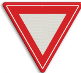
Vorrangskruising - verleen voorrang Haaiantanden