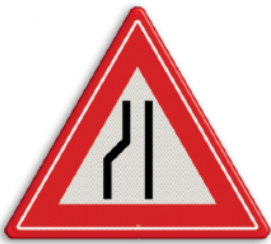
Rijbaan versmalling links